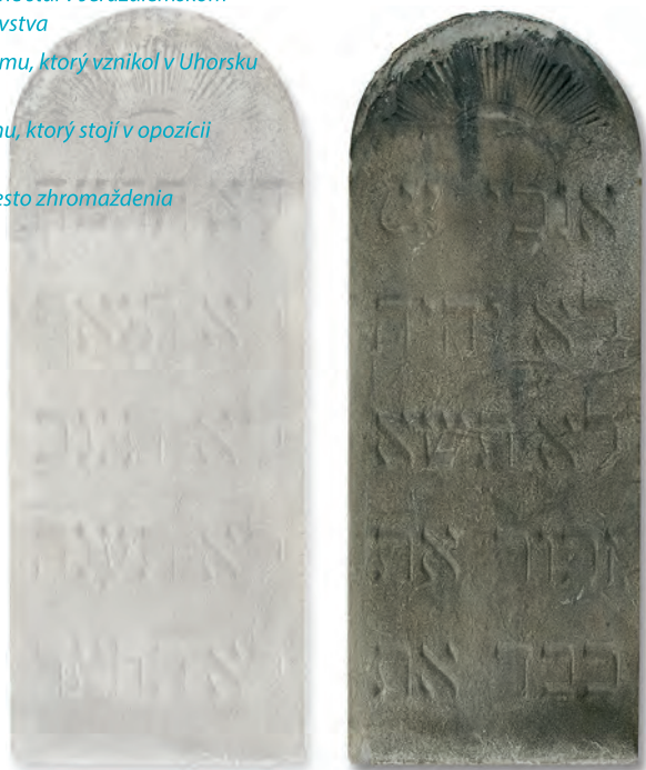
Desatoro z fasády synagógy je dnes vystavené v expozícii Židovského komunitného múzea

synagóga – hebr. beit kneset, modlitebňa a miesto zhromaždenia židovskej komunity