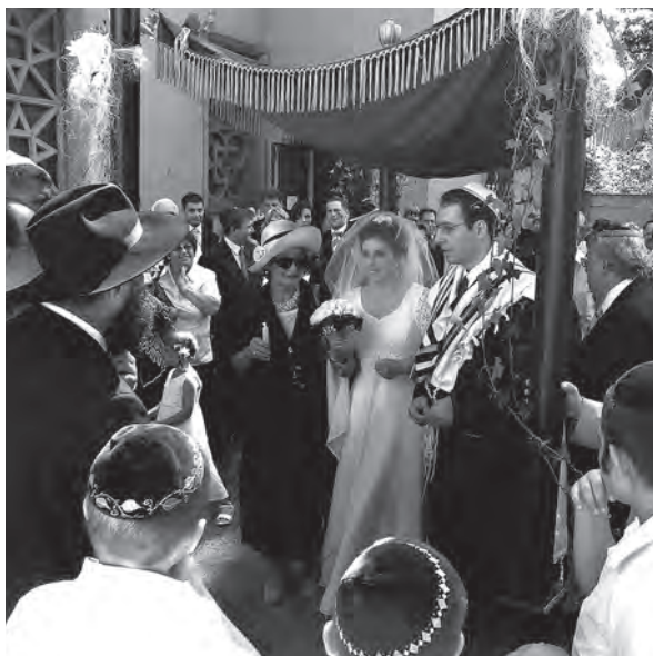
Svadba na nádvorí bratislavskej synagógy (2006)

Svadbe predchádzajú zasnuby. Počas svadobného obradu dáva ženich neveste prsteň a číta sa svadobná zmluva (ketuba) s povinnosťami manželov. Obklopení komunitou stoja obaja pod svadobným baldachýnom (chuppou), ktorý symbolizuje ich nový domov. Obrad vedie zväčša rabín. Ženich na konci obradu rozbije pohár, čo pripomína zničenie Jeruzalemského chrámu. Všetci manželom prajú veľa šťastia – mazal tov!