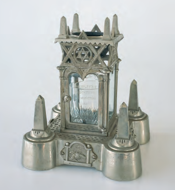
Svietnik na jarcajt, začiatok 20. storočia, Uhorsko