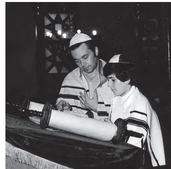
Slávnosť bar micva v bratislavskej synagóge (1973)

V niektorých synagógach slávia podobný obrad aj dievčatá, volá sa bat micva. Po slávnosti sú títo mladí ľudia plnoprávnymi členmi židovskej obce, zodpovedajú za svoje vlastné konanie.