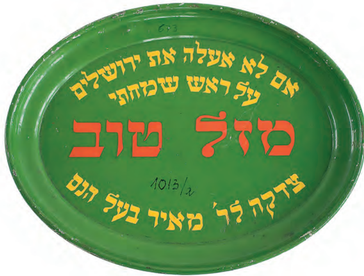
Tanier na milodary, v strede s nápisom Mazal tov (Vela šťastia!), používal sa pri svadbách na zbieranie peňazí pre chudobných v Svätej zemi.

Tóra – dosl. „náuka, učenie“; označuje Päť kníh Mojžišových (prvú časť Biblie), niekedy celú hebrejskú Bibliu, resp. písanú aj ústnu Tóru. Je základom židovského náboženstva.